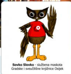
Sovko Slovko - službena maskota Gradske i sveučilišne knjižnice Osijek