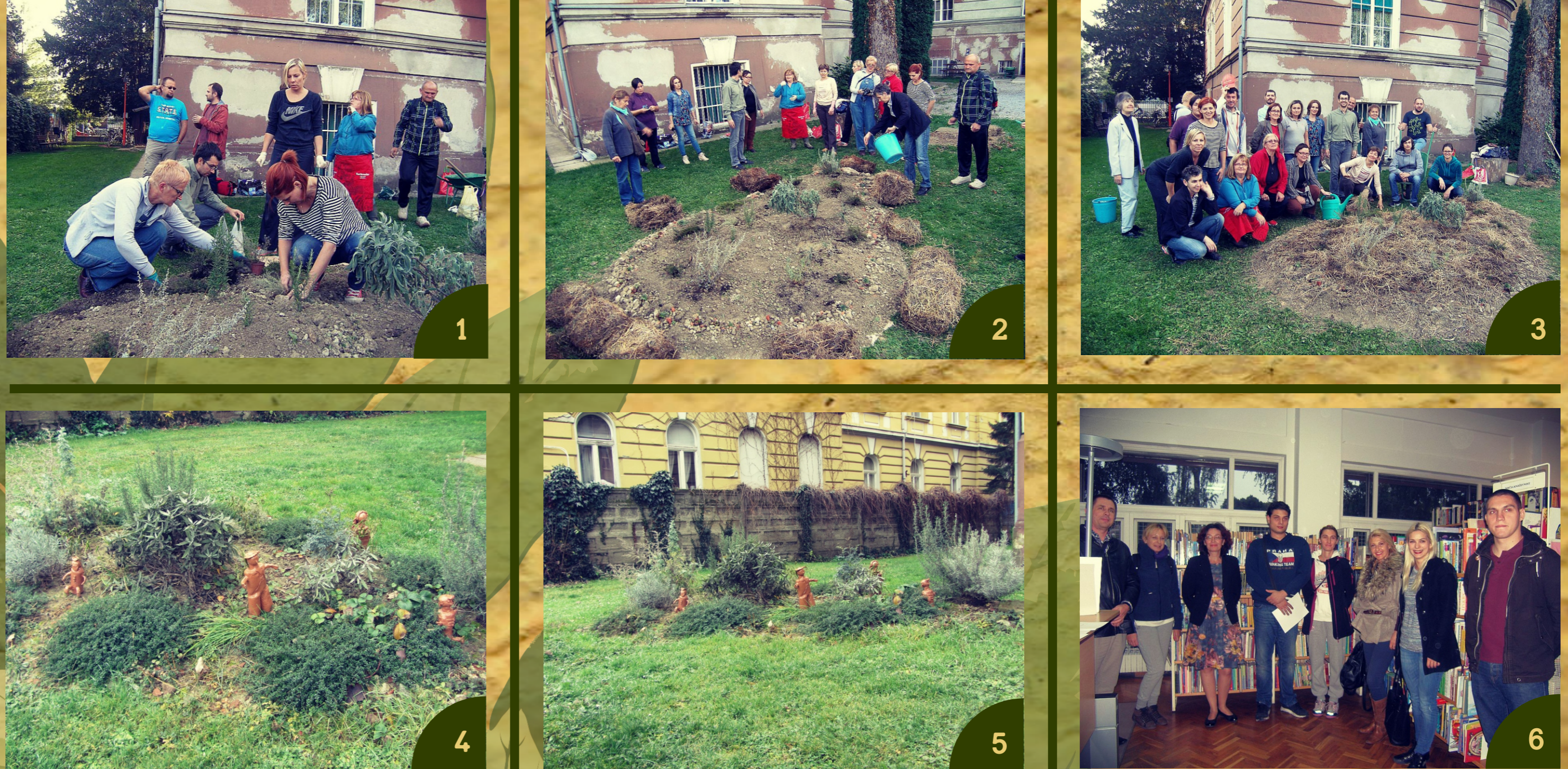
1) Sadnja biljaka prema dogovorenom rasporedu 2) Završno «dotjerivanje» vrta 3) Uspomena na uspješan projekt 4/5) Permakuilturni vrt - godinu dana poslije 5) Pobjednici nagradnog natječaja "Održivi gradovi"