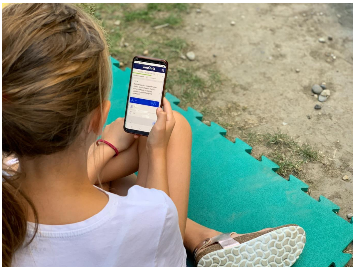
Slika 3. Kviz na GISKO tjednu Harryja Pottera 2020. godine

Svi koji su propustili neki od do sada održanih kvizova ili žele provjeriti svoje poznavanje književnosti, GISKO kvizovima mogu pristupiti putem mrežnih stranica Gradske i sveučilišne knjižnice Osijek, a GISKO kvizovi nastavljaju svoju treću sezonu.