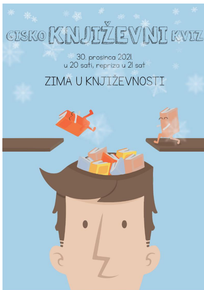
Slika 2. Plakat GISKO književnog kviza

S obzirom na uspješnu prvu sezonu, Knjižnica je i u 2021. godini nastavila s organizacijom kvizova u mrežnom okruženju. Sezona je započela kvizom o hrvatskoj književnosti i hrvatskim autorima, koji je imao i najveći broj sudionika u sezoni. Kako je veljača poznata kao mjesec ljubavi i kviz je za temu imao ljubavne romane, a kviz u ožujku nosio je naziv Žene u književnosti te je na taj način obilježen i Dan žena. Ostali kvizovi okupljali su određene žanrove, poput distopije i kriminalistike dok su poneki kvizovi temom bili vezani uz obilježavanje aktivnosti Knjižnice poput GISKO tjedna Harryja Pottera.