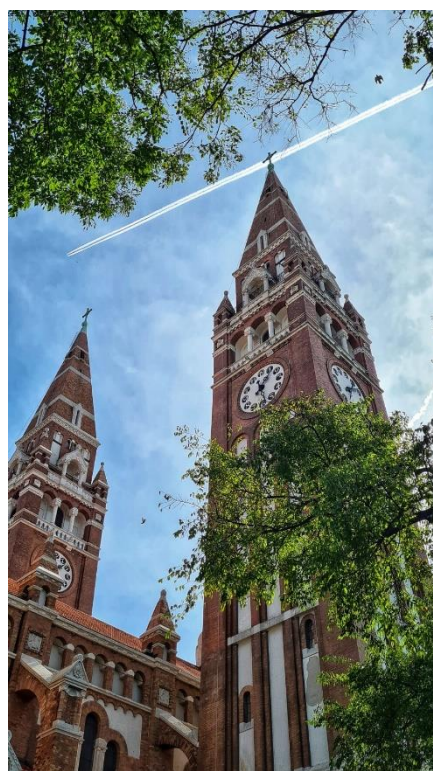
Franjevačka gotička crkva u Segedinu