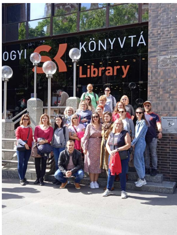
Knjižnica Somogyi u Segedinu

Nakon obilaska imali smo slobodno vrijeme za ručak. Ne možemo se pohvaliti da smo jeli neka tradicionalna jela, više je tu bilo hamburgera i ostalih brzih jela. Nakon ručka smo još jednom prošetali gradom i krenuli na dogovoreno mjesto susreta odakle smo kretali za Osijek.