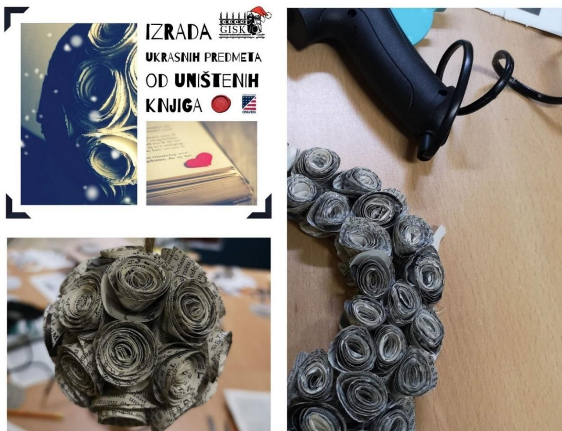
Slika 2. Posljednjih nekoliko godina kod nas u knjižnici najpopularniji zimski ukrasi izrađivani su poprilično jednostavnom, ali vremenski ipak nešto zahtjevnijom tehnikom. Za naučiti princip rada i izraditi manji predmet, poput kugle na fotografiji lijevo, dovoljna je jedna radionica u trajanju od dva sata, dok je izradi adventskog vijenca (fotografija desno) potrebno posvetiti više vremena.

Kada organiziramo jednostavnu kreativnu radionicu ili ne znamo točan broj polaznika, najčešće se odlučujemo za izradu likova ili modela origamijem. Tradicionalna tehnika te popularne vještine slaganja papira zahtijeva samo papir određenih dimenzija i petnaestak minuta do pola sata vremena. Modularni origami, nešto je veći izazov. Osim određenog broja papira istih dimenzija, potreban je i popriličan broj sati rada ili veći broj sudionika te, priznajemo, vrlo rijetko uspijemo izdvojiti dovoljno vremena da bismo u jednom danu završili započeto. Sličan princip rada kao kod modularnog origamija, gdje se izrađuje veći broj "jednakih" dijelova, koristimo na radionicama koje organiziramo pretežno u zimskim mjesecima jer su naj taj način nastali trenutno najpopularniji božićni ukrasi u Knjižnici. No ovdje se primjenjuje posve drukčija tehnika "slaganja" papira uz koji se koristi dodatni materijal, pribor i alat: olovka, škare, pištolj na vruće ljepljenje i podloga na koju se izrađeni dijelovi spajaju u cjelinu (slika 2.).