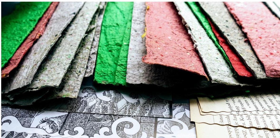
Slika 5. Komadiće različitih vrsta papira i kartona preostale od kreativnih radionica koristimo za izradu novog papira koji se može vidjeti na fotografiji.

Komadići papira koji ostanu nakon provedbe bilo koje od navedenih radionica odvajaju se za radionicu na kojoj izrađujemo reciklirani papir (slika 5.). Cjelokupan proces recikliranja papira, od pripreme starog papira za preradu pa sve do sušenja novonastalog, traje nekoliko dana, ali radionica nije komplicirana i prilagođena je svim dobnim skupinama, a njezina provedba s polaznicima traje u rasponu od jednog do tri sata, ovisno o broju sudionika i količini materijala koji se priprema. Godišnje provedemo desetak takvih radionica, a na svakoj nastane dovoljno recikliranog papira za jednu ili dvije kreativne radionice. Moramo napomenuti da ne pravimo uvijek papir u klasičnom obliku, ponekad to budu papirnate "bombice", koje u sebi kriju sjemenke voća, povrća, začinskog ili ukrasnog bilja te su najmanjim polaznicima zanimljiva pomoć u njihovu vrtlarstvu. Od iste mase mogu se oblikovati i različiti jednostavniji oblici, a uz dodatak ljepila i oni kompliciraniji.