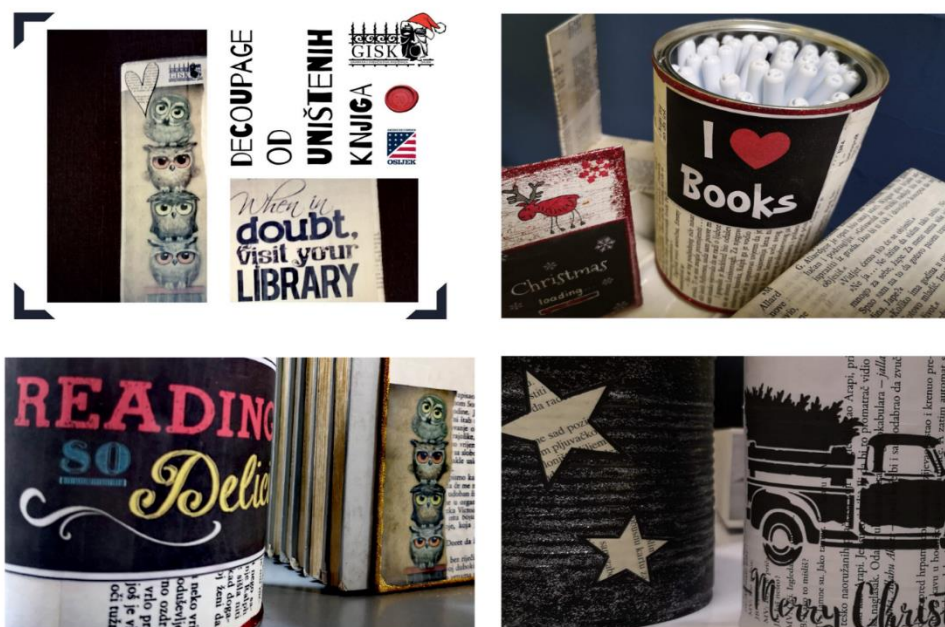
Slika 4. Tijekom godine nastojimo održati barem jednu decoupage radionicu. Polaznike najčešće upoznajemo s decoupageom od papira budući da je upravo papir najzahvalniji materijal jer ne zahtijeva nikakvu posebnu pripremu predmeta koji se ukrašava.