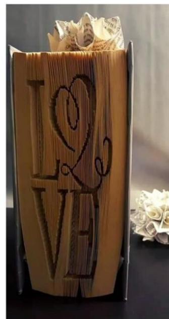
Slika 3. Jedan od rijetkih primjera kada je knjiga u dovoljno dobrom stanju da se iskoriste skoro svi njezini dijelovi.

Najpoznatija decoupage tehnika ona je u kojoj se koriste salvete. Na našim radionicama salvete koristimo nešto rjeđe jer njihova prozirnost često zahtijeva prethodno bojanje podloge, dok decoupage od papira ne zahtijeva nikakvu posebnu pripremu podloge te ga koristimo za ukrašavanje predmeta izrađenih od svih vrsta materijala (slika 4. i slika 1.). Već godinama ne koristimo posebno ljepilo za decoupage, već svaki sloj papira prije i nakon nanošenja na podlogu, kistom premazujemo mješavinom drvofiksa i vode.