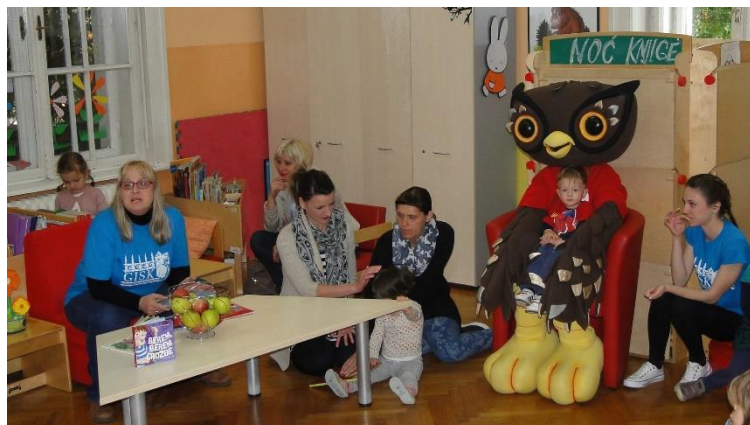
Slika 3. Noć knjige na Odjelu za rad s djecom i mladima