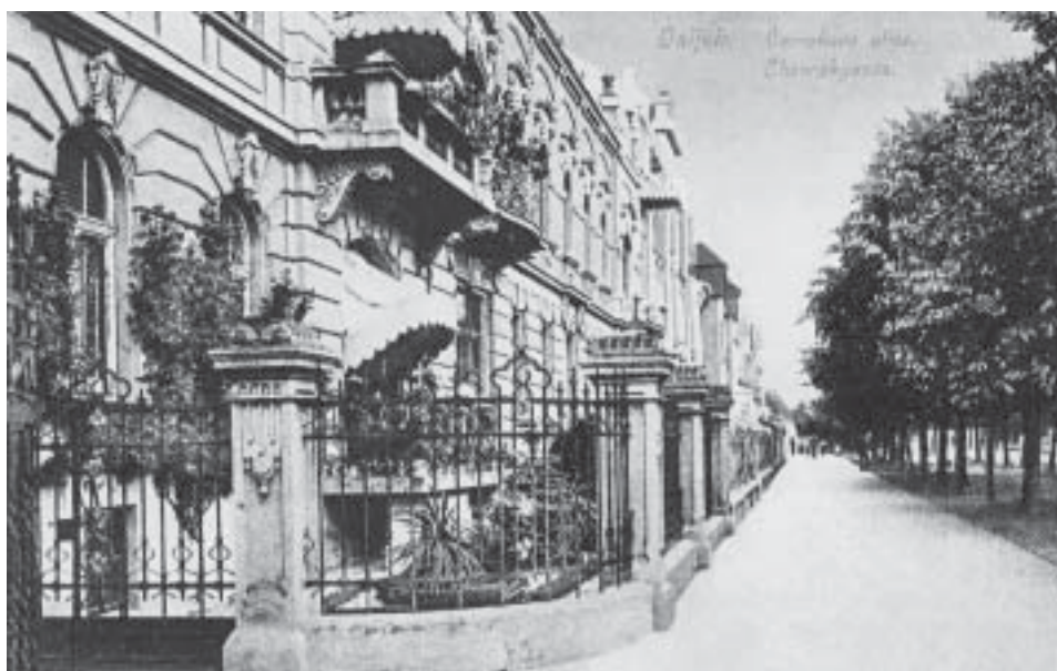
Slika 1. Niz kuća s predvrtovima u Chavrakovoj ulici (danas Europska avenija)