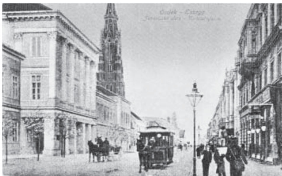
Slika 2. Županijska ulica s katedralom