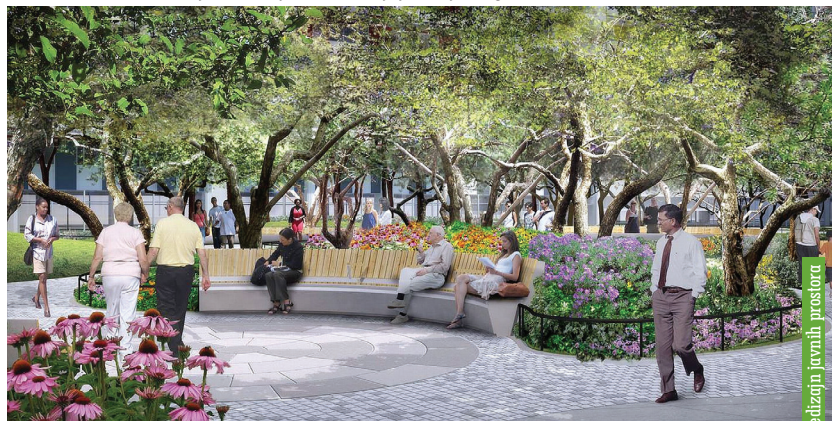
Redizajn javnih prostora

Biljni uređaji za pročišćavanje otpadnih voda najčešći su sustavi za recikliranje i vraćanje pročišćene vode u upotrebu. Pročišćena voda je toliko čista da se može pustiti u vodotoke, ali se najčešće upotrebljava za navodnjavanje zelenih površina, zalijevanje cvjetnih parkovnih gredica, strojno pranje ulica i trgova...Mogu se izgraditi i umjetne akumulacije sa trskom i drugim vodenim ukrasnim biljkama koje se postavljaju umjesto gradskih fontana.