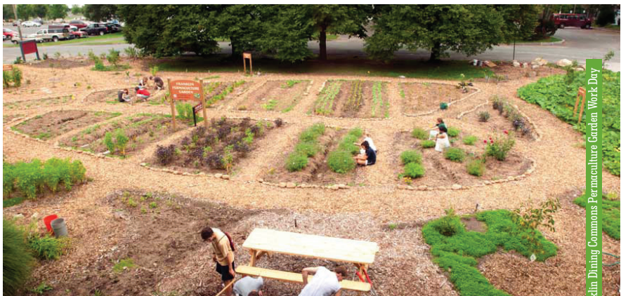
Franklin Dining Commons Permaculture Garden Work Day

Permakultura se temelji na razvijanju svijesti i usvajanju tradicionalnih vrijednosti koje će omogućiti biološki i kulturni opstanak. Njeni etički principi i dizajn se prožimaju kroz sve strukture življenja kako bi omogućili samoodrživost zajednice. Ona se u mnogome razlikuje od suvremenih normi i koncepata življenja, a kako već rekoh, odnosi se na brigu o planeti Zemlji i smanjenje vlastitog utjecaja na životnu okolinu, kao osnovnog principa. U opću brigu o Zemlji uvrštena je briga o ljudima, razvijanje ljubavi i poštovanja prema samom sebi, što je preduvjet za ljubav i poštivanje drugih živih bića. Društvena suradnja, fokusiranje na pozitivnost i prihvaćanje osobne odgovornosti drugi je princip permakulturne etike. I na kraju, pravilna raspodjela, koja podrazumijeva umjerenost u trošenju prirodnih i društvenih resursa i uspostavljanje individualne a time i društvene ravnoteže, treći je etički princip permakulture.