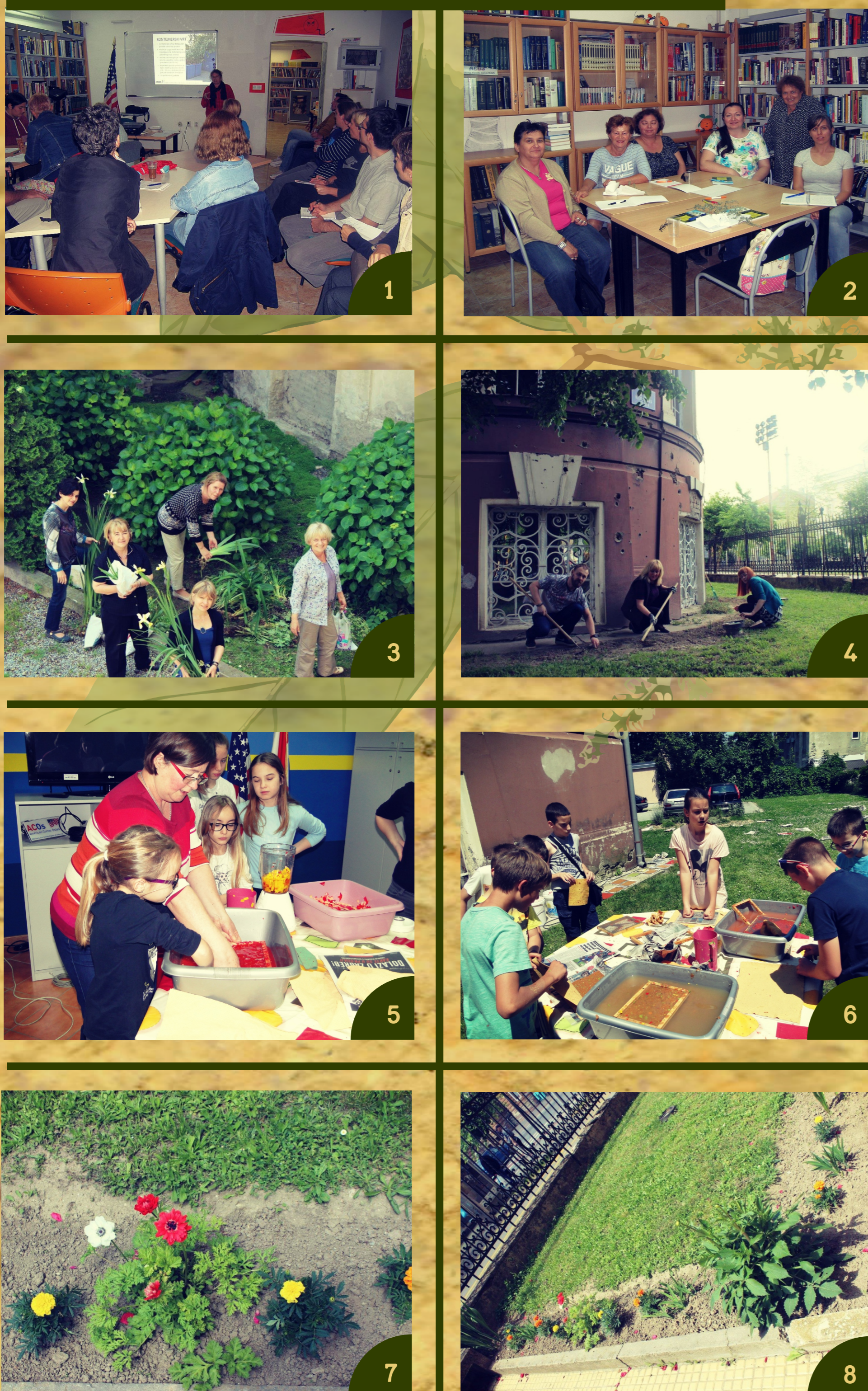
1) Uvodno predavanje i prezentacija 2) Polaznice s druge sezone radionica 3) "Zelene" knjižničarke 4) Knjižničari u eko akciji 5/6) S radionice recikliranja papira 7/8) Cvijeće u dvorištu knjižnice