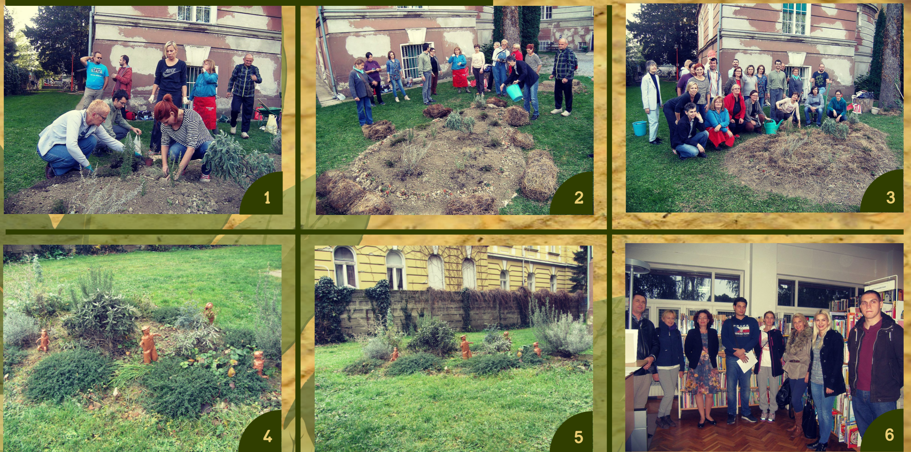
1) Sadnja biljaka prema dogovorenom rasporedu 2) Završno «dotjerivanje» vrta 3) Uspomena na uspješan projekt 4/5) Permakulturni vrt - godinu dana poslije 5) Pobjednici nagradnog natječaja "Održivi gradovi"