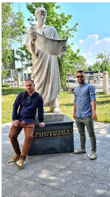
Kip na ulazu u Poljoprivredni fakultet u Štipu i oznaka ispred Erasmus ureda unutar Fakulteta