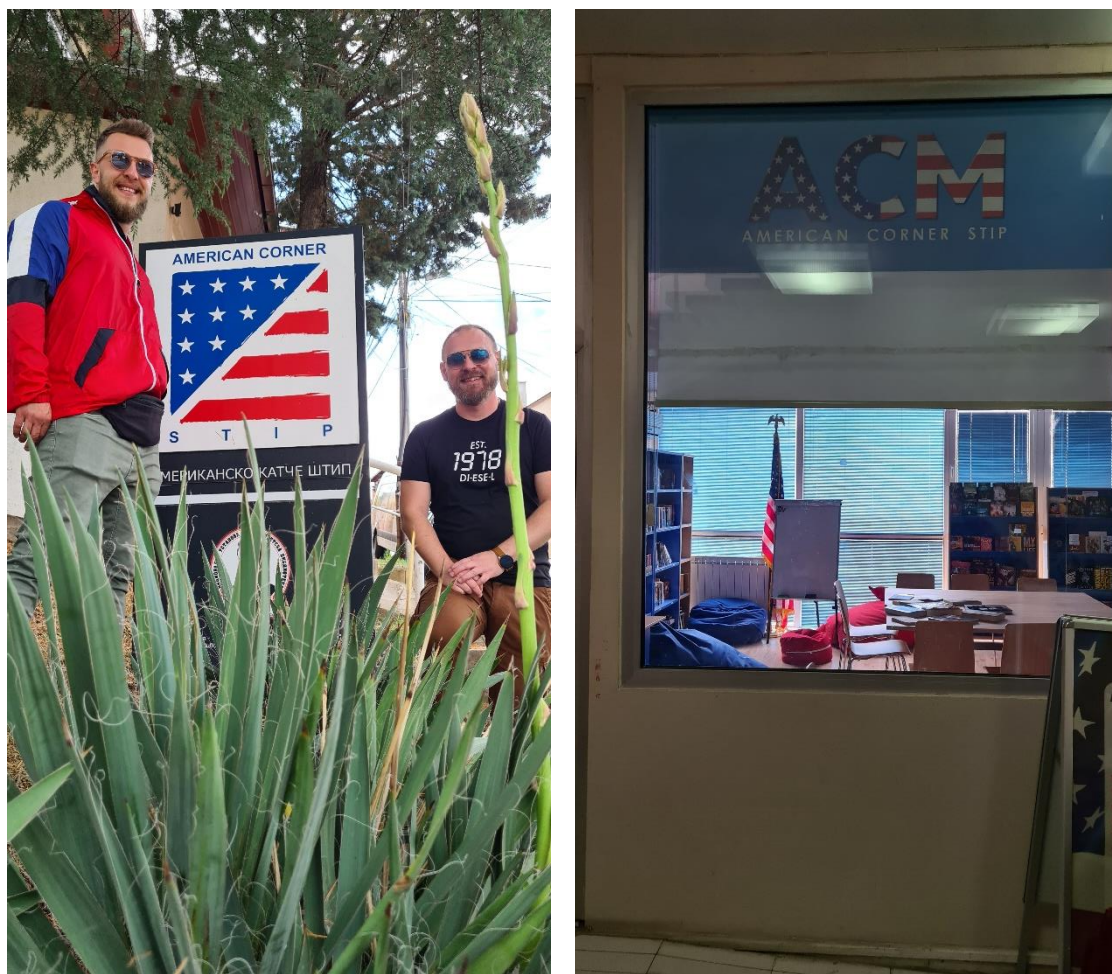
American Corner koji djeluje u sklopu knjižnice "Goce Delčev" Štipa

nas je potakla i na neka razmišljanja o unapređivanju rada kutka u domovini. Određene sličnosti povezuju Štip i Osijek i kroz bibliobusnu službu. Osječki bibliokombi dostavlja knjižničnu građu osobama koje nisu u mogućnosti fizički posjetiti knjižnicu i kao iznimno bitna usluga pokazao se za vrijeme pandemije COVID 19, kada je osiguravao dostupnost knjižničnoj građi osobama u izolaciji i samoizolaciji. Bibliobus u Štipu pak ima nešto šire područje djelovanja, obilazi grad i okolna ruralna područja, olakšavajući pristup informacijama stanovnicima manjih mjesta koja nemaju svoje knjižnice.