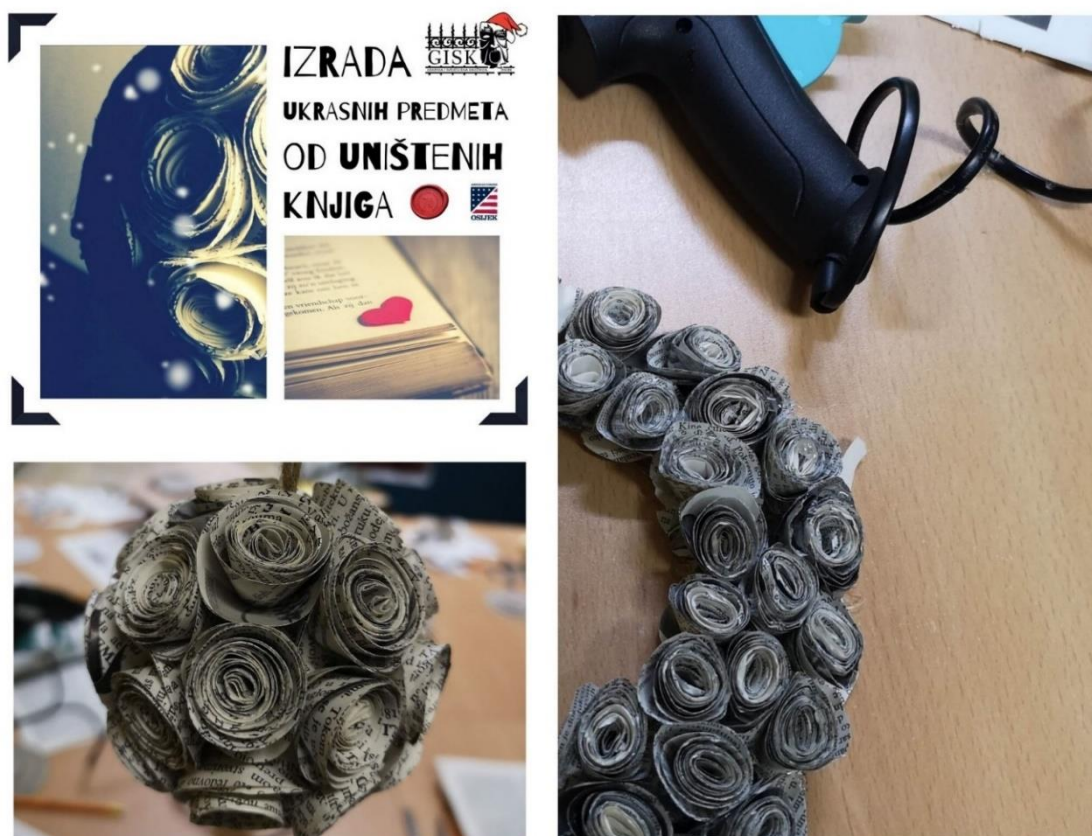
Slika 2. Posljednjih nekoliko godina kod nas u knjižnici najpopularniji zimski ukrasi izrađivani su poprilično jednostavnom, ali vremenski ipak nešto zahtjevnijom tehnikom. Za naučiti princip rada i izraditi manji predmet, poput kugle na fotografiji lijevo, dovoljna je jedna radionica u trajanju od dva sata, dok je izradi adventskog vijenca (fotografija desno) potrebno posvetiti više vremena.

Kada organiziramo jednostavnu kreativnu radionicu ili ne znamo točan broj polaznika, najčešće se odlučujemo za izradu likova ili modela origamijem. Tradicionalna tehnika te popularne vještine slaganja papira zahtijeva samo papir određenih dimenzija i petnaestak minuta do pola sata vremena. Modularni origami, nešto je veći izazov. Osim određenog broja papira istih dimenzija, potreban je i popriličan broj sati rada ili veći broj sudionika te, priznajemo, vrlo rijetko uspijemo izdvojiti dovoljno vremena da bismo u jednom danu završili započeto. Sličan princip rada kao kod modularnog origamija, gdje se izrađuje veći broj "jednakih" dijelova, koristimo na radionicama koje organiziramo pretežno u zimskim mjesecima jer su naj taj način nastali trenutno najpopularniji božićni ukrasi u Knjižnici. No ovdje se primjenjuje posve drukčija tehnika "slaganja" papira uz koji se koristi dodatni materijal, pribor i alat: olovka, škare, pištolj na vruće ljepljenje i podloga na koju se izrađeni dijelovi spajaju u cjelinu (slika 2.).