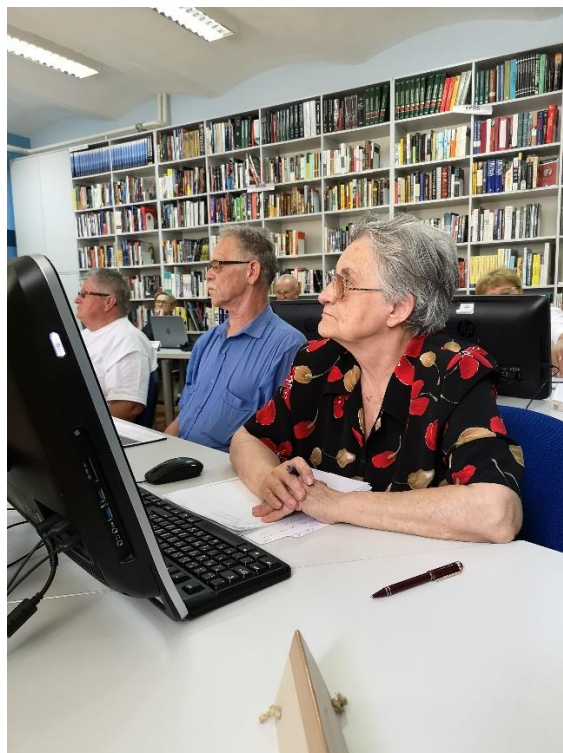
Slika 3. Polaznici radionica