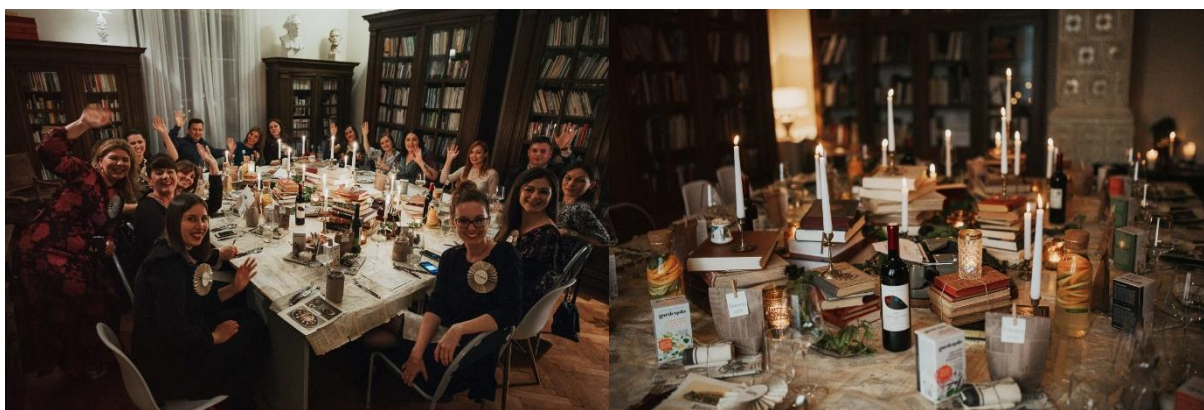
Slika 4. Sudionici Tajne večere

U prostorima Knjižnice dočekala ih je i pozdravila kolegica Špoljarić Kizivat koja im je ispričala ponešto o posebnosti same prostorije u kojoj će večerati. Od originalnoga inventara dr. Vjekoslava Hengla, osječkoga odvjetnika i budućega gradonačelnika, do danas, u Knjižnici su sačuvane kaljeve peći, 4 ormara u kojima se nalazila obiteljska knjižnica, stol i stolica. Ostaci nekadašnjega duha vremena u kojemu se razvijala knjižnica, u današnjoj su sobi gdje je smještena Zavičajna zbirka, najvrjednija zbirka Knjižnice. Zbirka obuhvaća građu od značaja za Grad Osijek i Sveučilište Josipa Jurja Strossmayera u Osijeku (Mursianu), kao i Županiju osječko-baranjsku i Slavoniju (Slavonica).