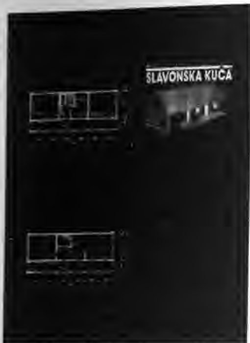
Objekt Slavonska kuća