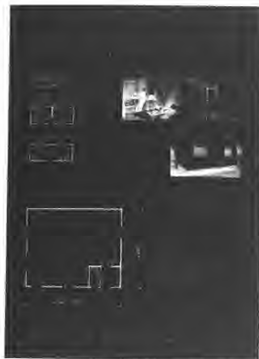
Objekt TIBO - kontejner