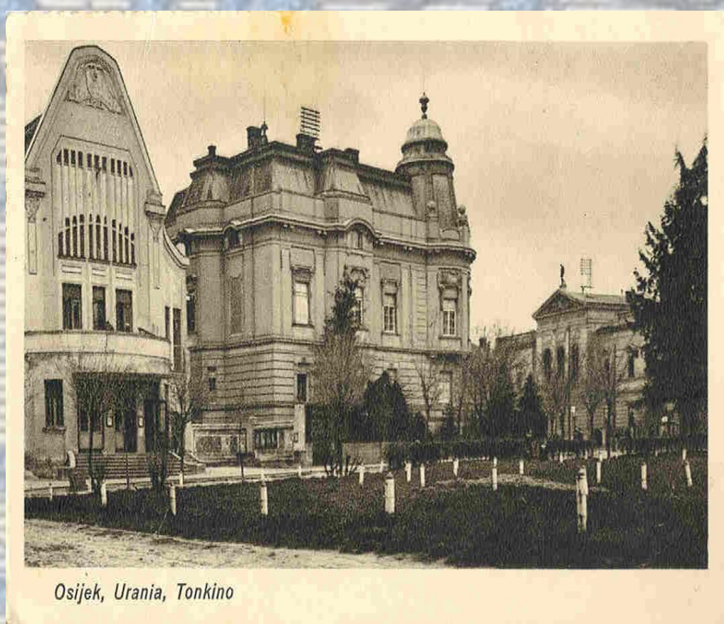
Osijek, Urania, Tonkino

Digitalizacija razglednica starog Osijeka započela je 2011. godine.