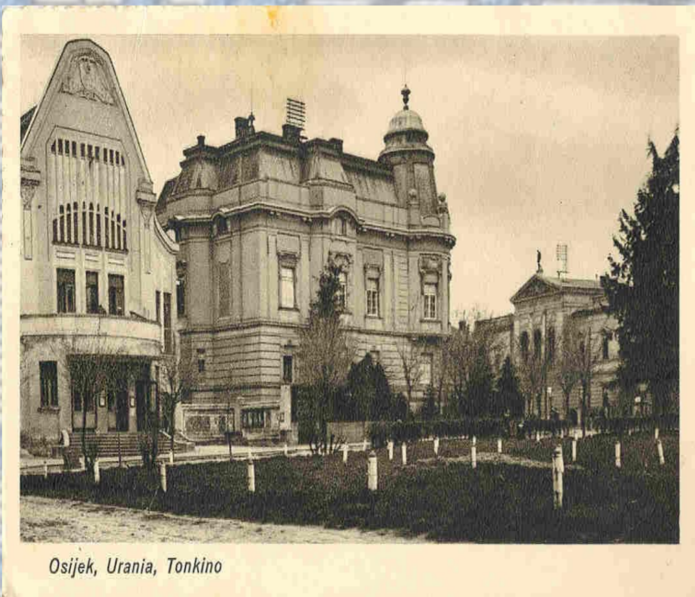
Osijek, Urania, Tonkino

Digitalizacija razglednica starog Osijeka započela je 2011. godine.