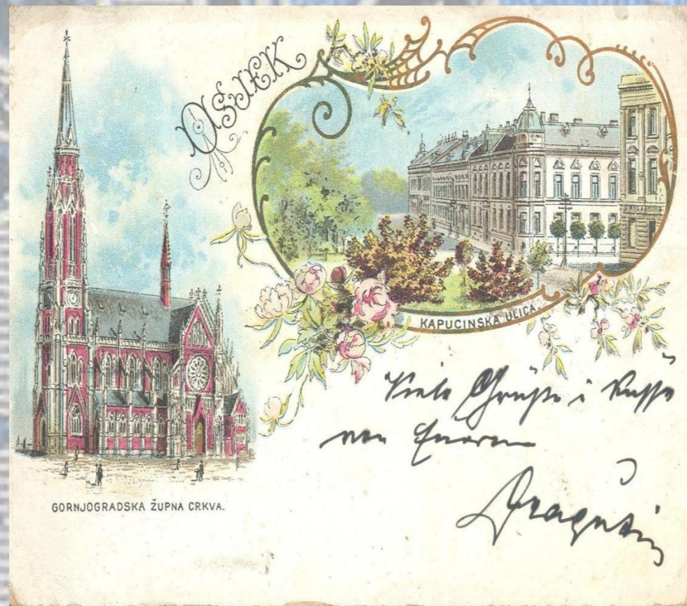
OSJEK GORNJODRAČKA ŽUPNA CRKVA.