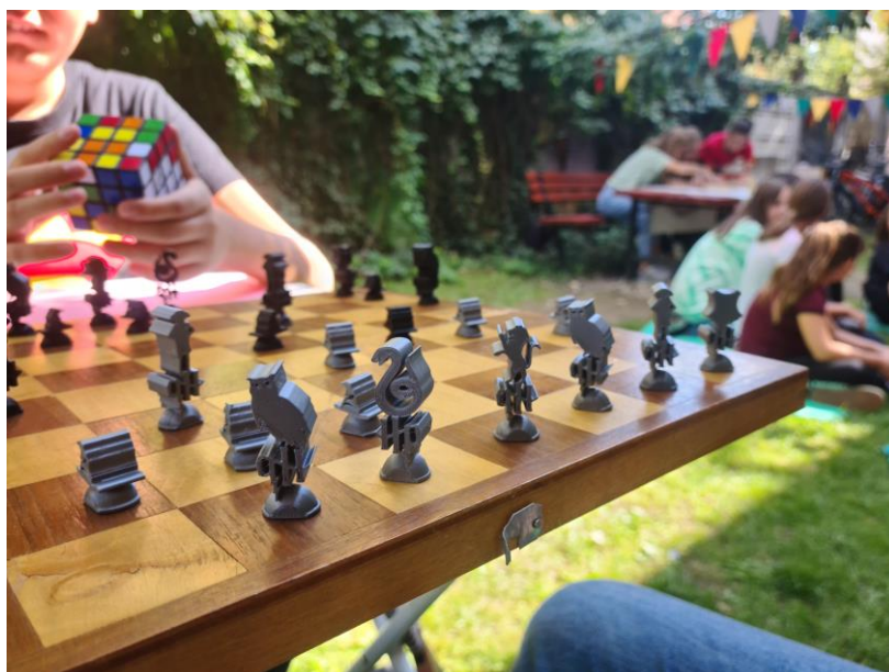
Slika 2. Društvene igre

Posljednji dan manifestacije sudionici su proveli igrajući društvene igre u znaku Harryja Pottera, poput pantomime, Pictionaryja, puzzle, igre Pogodi tko, čarobnjačkog šaha, igre Sedam Harryja i druge. Č.A.S. provjera znanja sadržavala je 30 pitanja o čarobnom svijetu Harryja Pottera, a pobjednik je dobio i poseban dar kao nagradu za pokazano znanje.