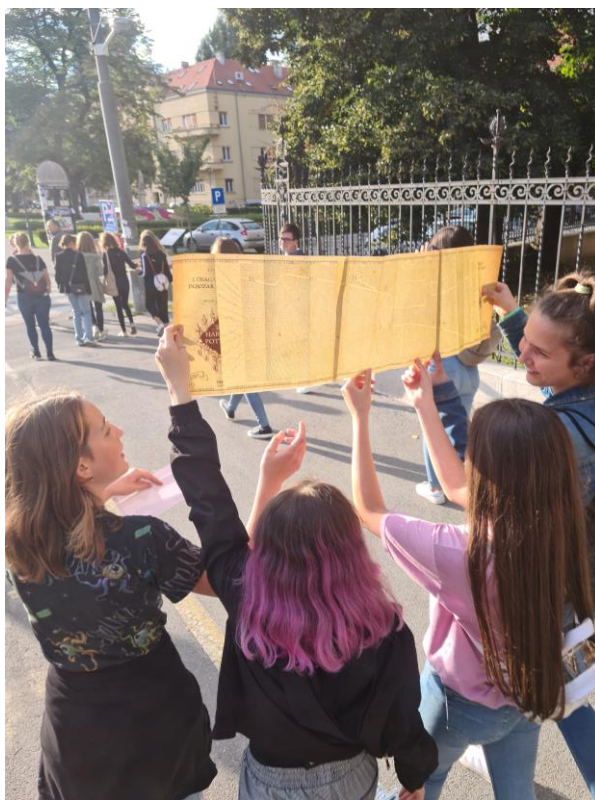
Slika 1. Potraga-koja-se-ne-smije-imenovati

su odgonetnuli zagonetke i premetaljke čija su ih rješenja vodila na različite odjele u Knjižnici. Potraga za horkruksima omogućila je prisutnima i svojevrsnu šetnju kroz odjele Knjižnice kojima inače ne prolaze. Potraga-koja-se-ne-smije-imenovati bila je namijenjena čarobnjacima od 14 godina na više, a odvijala se u centru grada Osijeka. Svaka skupina dobila je vlastitu Mapu za haranje koja je sadržavala plan centra grada te označena mjesta na kojima se nalaze tragovi. Tako je na oglasnom stupu u Sakuntala parku obješen Oglas za vukodlakove suze sačuvane u vodi potoka Zabranjene šume. Na izlogu novootvorene trgovine s društvenim igrama u Kapucinskoj ulici bilo je potrebno očitati QR kod sa zagonetkom, a na Trgu A. Starčevića sudionike su čekali studenti informatologije s Harry Potter kravatama i zadatkom preračunavanja čarobnjačkog novca.