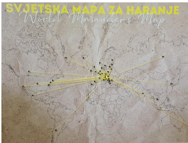
Slika 3. Svjetska mapa za haranje

društvenih mreža. Motivi su fotografija naslovnice knjiga na različitim jezicima, fotografirane u gradovima u blizini knjižnica ili drugih znamenitosti. Izložbu plakata bilo je moguće pogledati u izložbenoj auli Gradske i sveučilišne knjižnice Osijek do 20. rujna, dok su interaktivna karta, virtualna izložba i galerija svih pristiglih fotografija trajno dostupne putem mrežnih stranica.