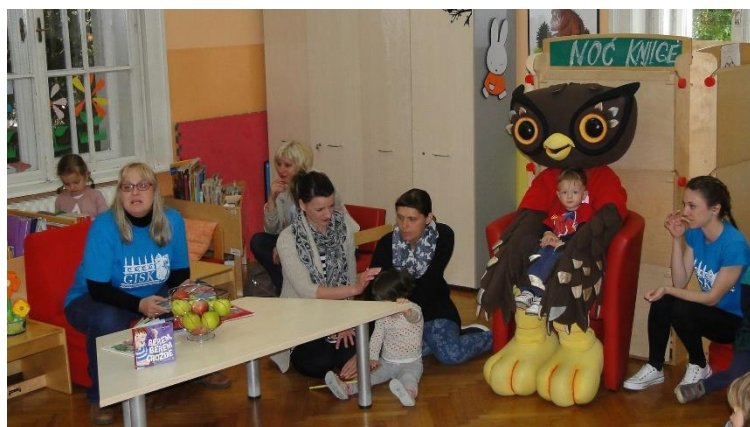
Slika 3. Noć knjige na Odjelu za rad s djecom i mladima

Ovogodišnja Noć knjige u Gradskoj i sveučilišnoj knjižnici Osijek imala je i jedan uistinu originalan dio programa. Knjige, književnost i prostor knjižnice, tim popularnoga projekta „Secret dinner by Filipa Sorko“ više je nego inspirirao te su već i pozivnice mogle naslutiti koja je točno tema ove „Tajne večere“. Zidovi prostorije koju je Filipi i njezinu timu Knjižnica ustupila na korištenje, bili su prekriveni velikim, starinskim, drvenim ormarima prepunim knjigama te su poslužiti kao savršena kulisa magičnoj književnoj „Tajnoj večeri“ koja se spremala. Kada se kreativni tim unio u temu, jela na jelovniku dobila su imena poznatih književnih djela i pisaca.